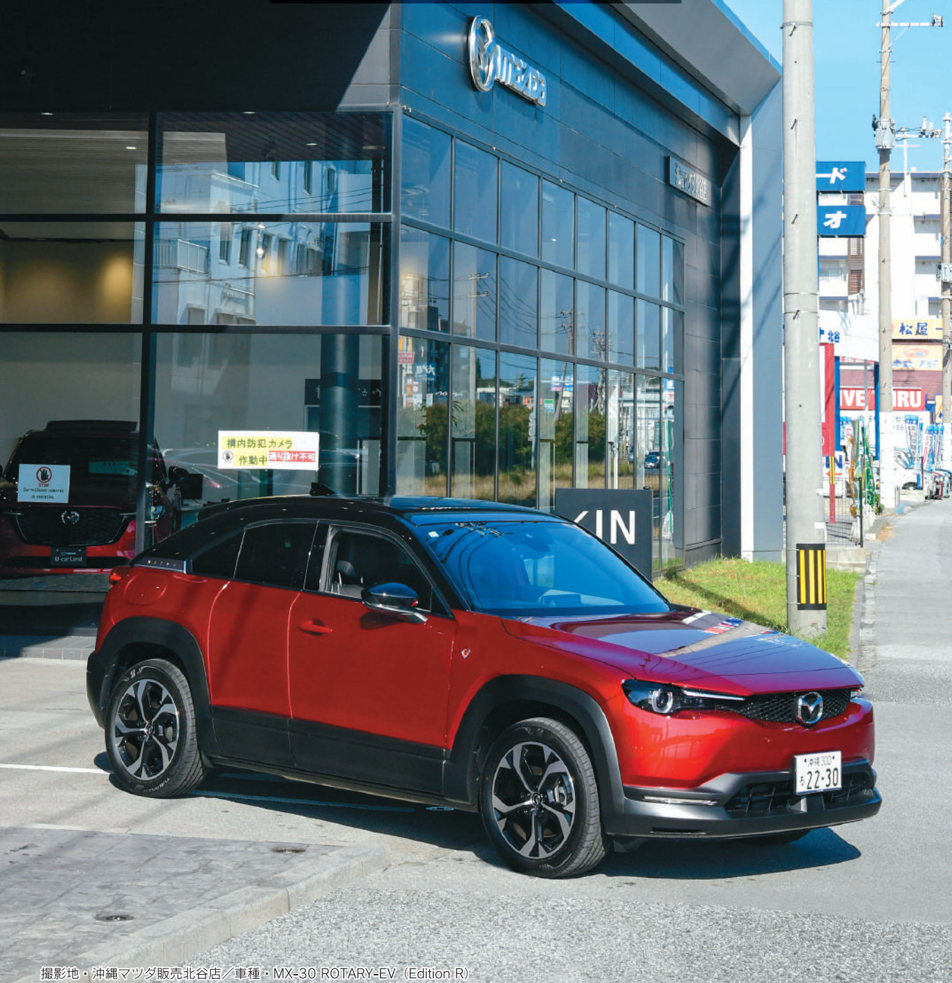
撮影地・沖縄マツダ販売北谷店／車種・MX-30 ROTARY-EV (Edition R)