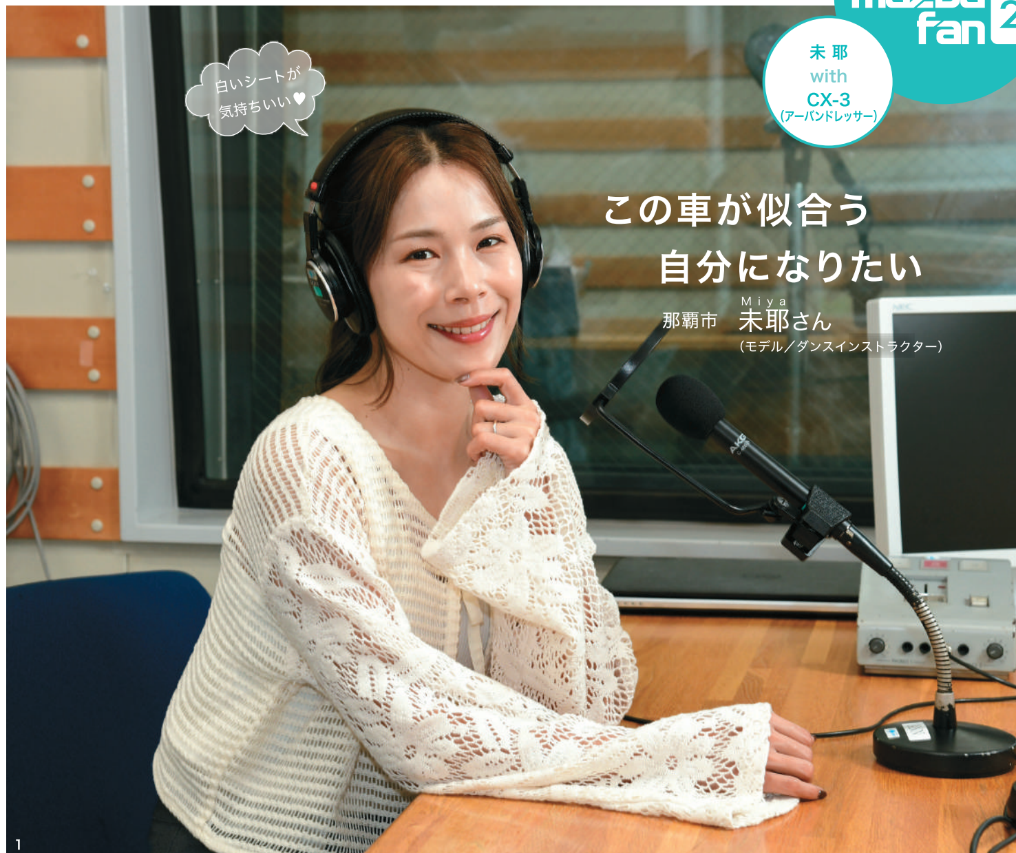
1.FM沖縄のブースにて。「マツダZOOM ZOOM HOUR」は月曜の14:50から好評放送中 2.CX-3のフロント。「黒い「耳」(ドアミラー)が引き締まった印象を与える」と未耶さん談 3.ピュアホワイトとブラウンのシートが「アーバンドレッサー」の特徴。ブラウンは人工皮革のグランリュクスで、ダッシュボードとドアリムにも使用されている 4.番組の収録でロードスターに試乗した時の写真。奥は当時のマツダスタッフ